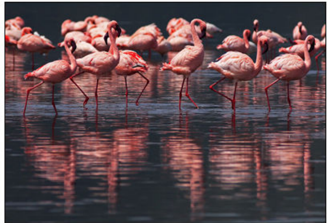
Nakuru'da pelikan ve flamingolar