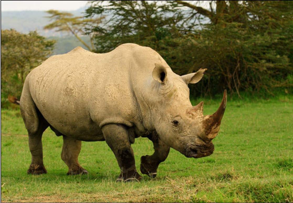
Gergedan – Nakuru Milli Parkı

Sabah gün doğmadan kalkış, lobide çay – kahve – kurabiye atıştırdıktan sonra Masai Mara'nın uçsuz bucaksız düzlüklerinde safariye çıkış. Kahvaltı için Lodge'a dönüş ve kahvaltının ardından kültürlerini, danslarını ve yaşam biçimlerini görüp fotoğraf çekebilmek için bir Masai Köyüne ziyaret. Öğlen yemeği için otele dönüş veya otelden Lunch Box olarak akşam yemeğine kadar arazide kalış. Akşam yemeği ve geceleme Mara Sarova'da.