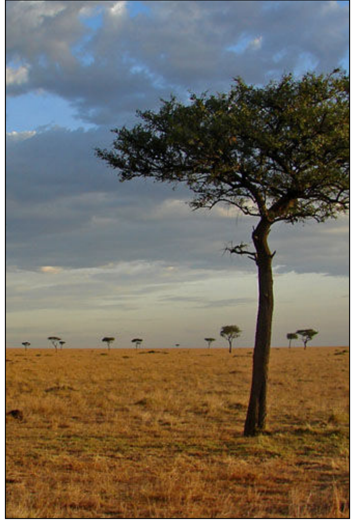
Masai Mara – Burak Doğansoysal ©