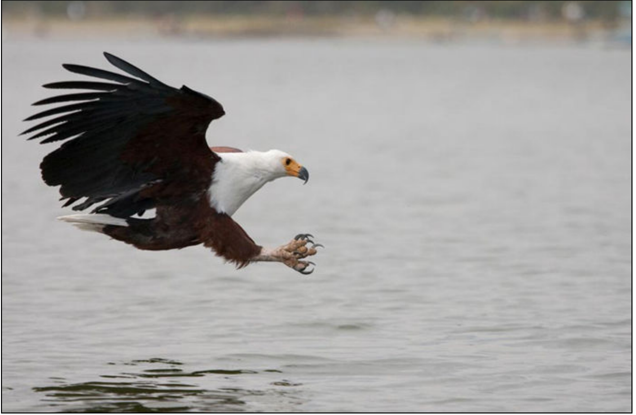
Afrika Balık Kartalı – Melih Özbek © Dijital Akademi / www.dijitalakademi.com