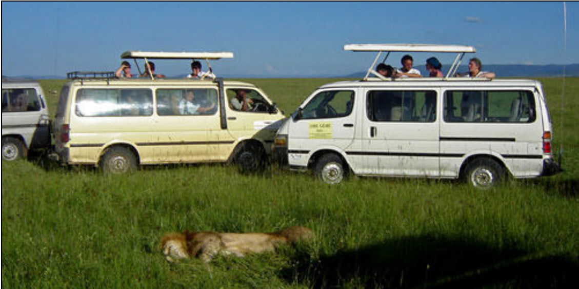
Transferler ve safariler üstü açılabilen safari van 'larla yapılacaktır.