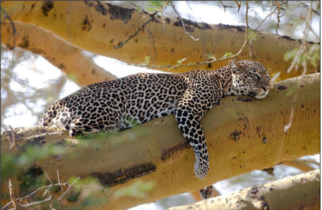
Nakuru'da bir leopar